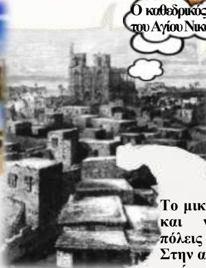
Οθωμανική εισβολή και κατάκτηση 1571-1878