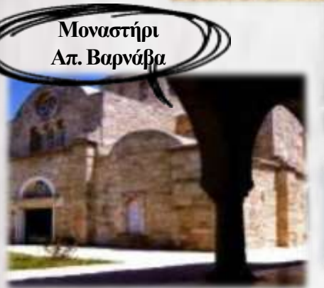
Μοναστήρι Απ. Βαρνάβα