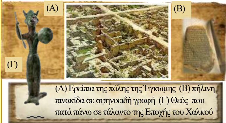
(Α) Ερείπια της πόλης της Έγκωμης (Β) πλήρη πινακίδα σε σφηνοειδή γραφή (Γ) Θεός που πατά πάνω σε τάλαντο της Εποχής του Χαλκού